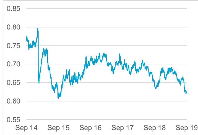
NZD / CHF