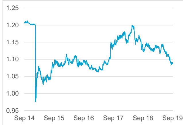
EUR / CHF