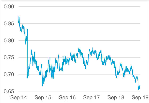
AUD / CHF