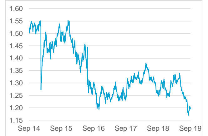
GBP / CHF