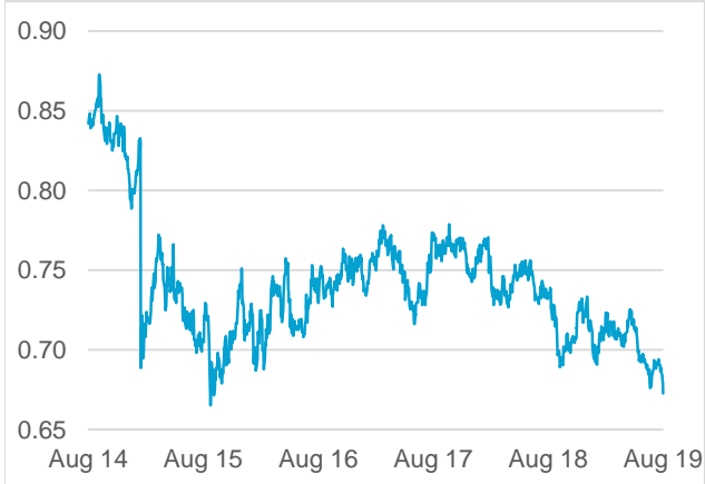
AUD / CHF