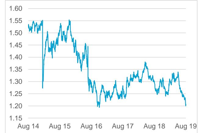
GBP / CHF