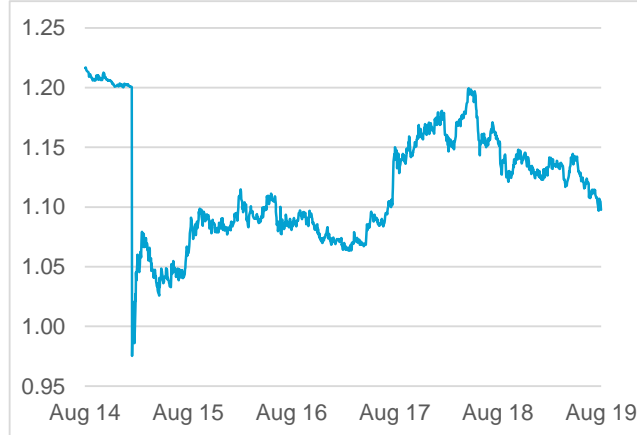
EUR / CHF