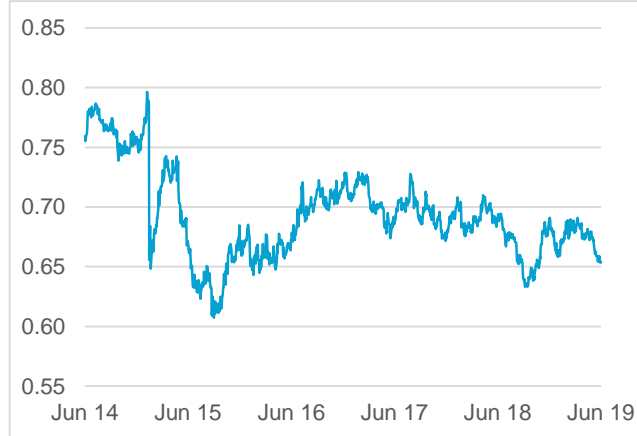
NZD / CHF