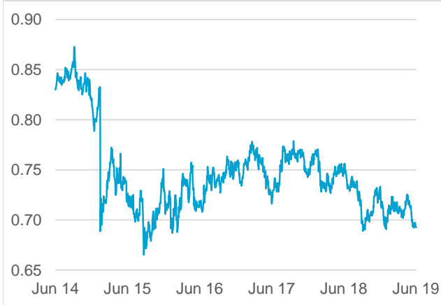
AUD / CHF