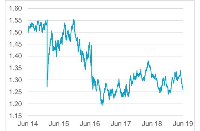
GBP / CHF