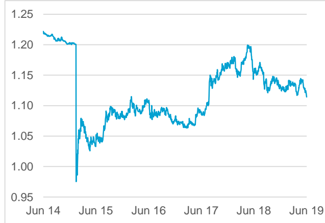
EUR / CHF