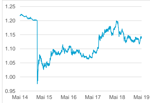
EUR / CHF