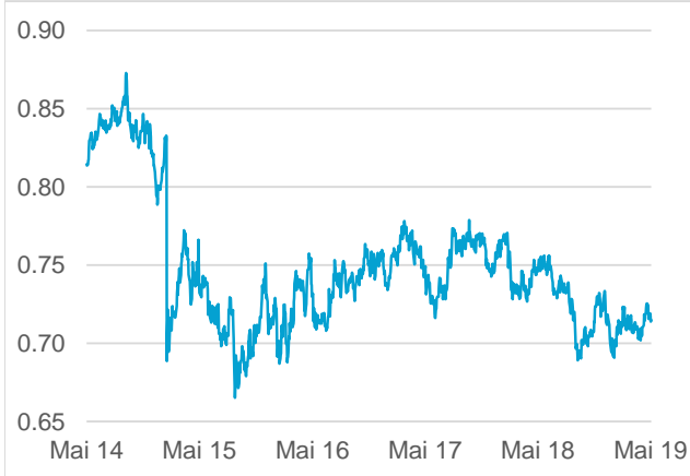
AUD / CHF