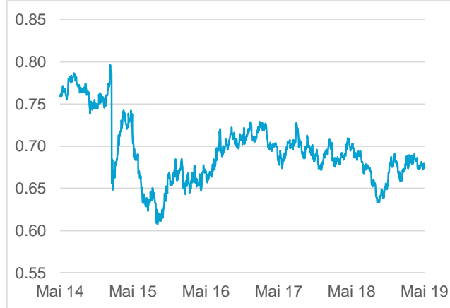
NZD / CHF