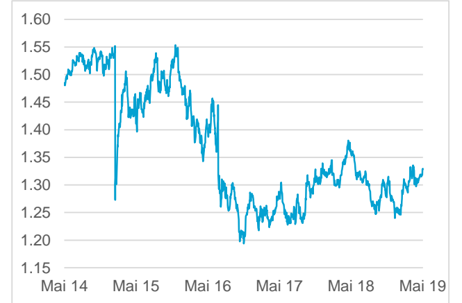
GBP / CHF