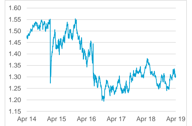
GBP / CHF