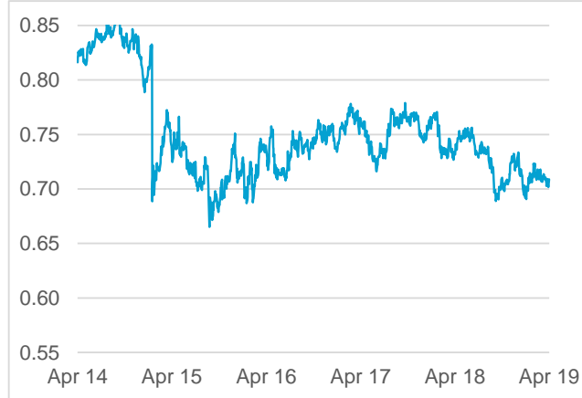
NZD / CHF