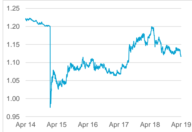
EUR / CHF