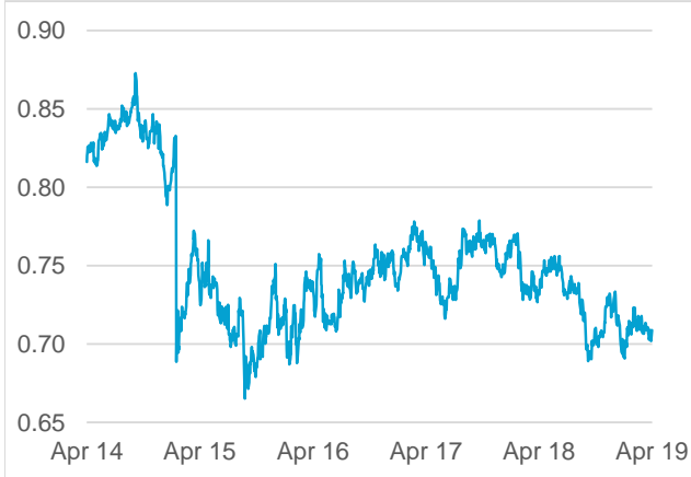
AUD / CHF