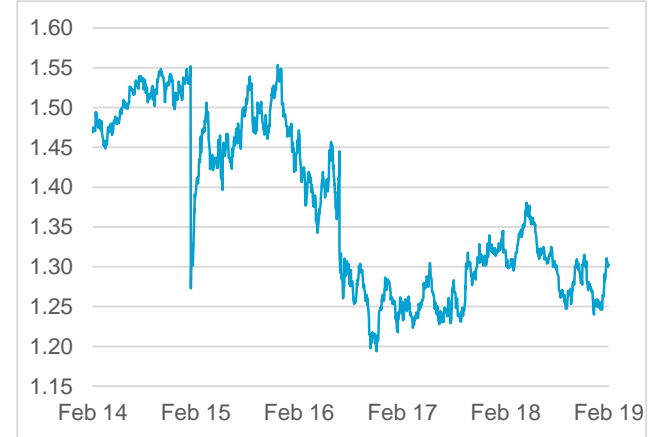
GBP / CHF