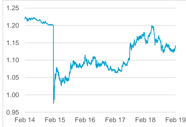
EUR / CHF