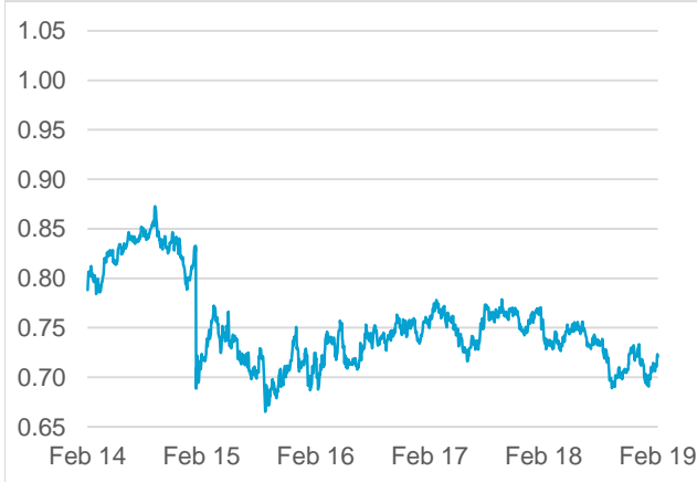
AUD / CHF