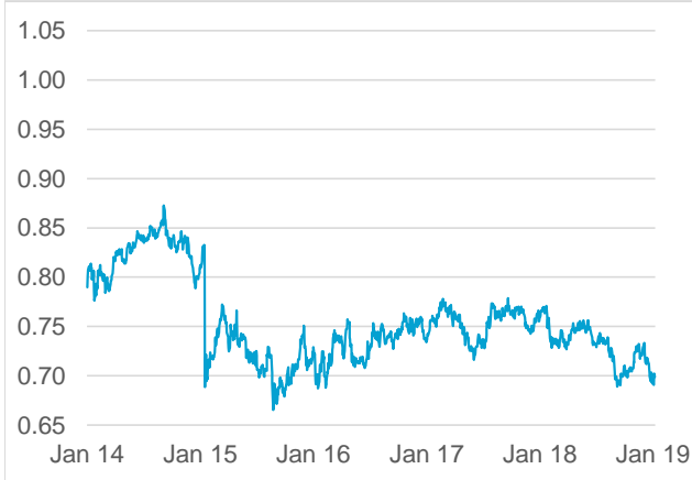
AUD / CHF