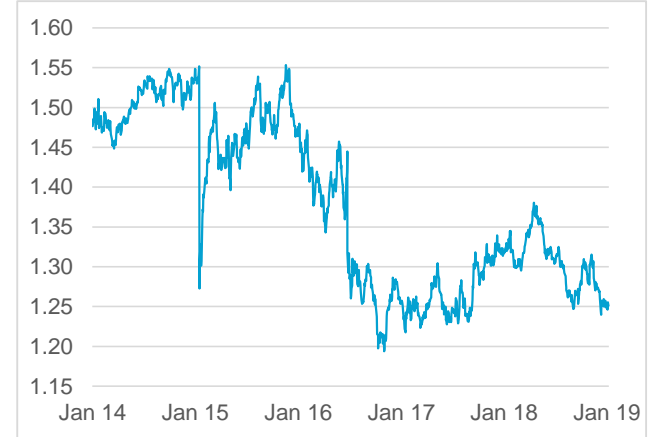
GBP / CHF