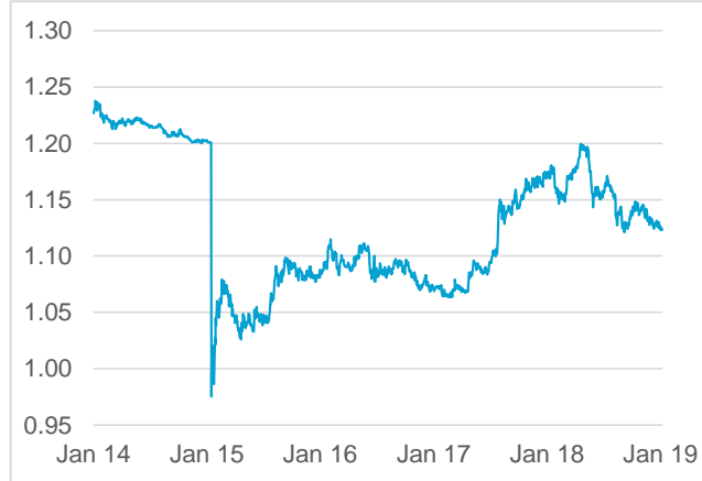
EUR / CHF