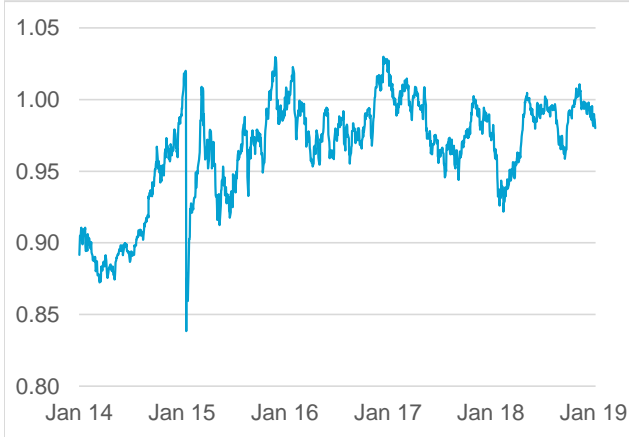
USD / CHF