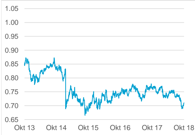
AUD / CHF