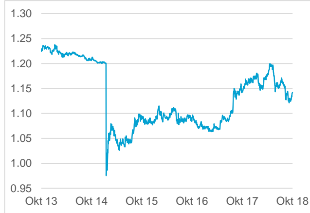
EUR / CHF