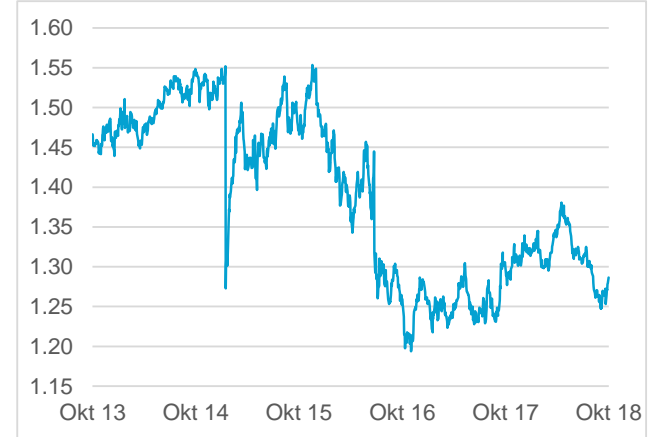
GBP / CHF